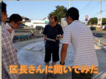
区長さんに聞いてみた